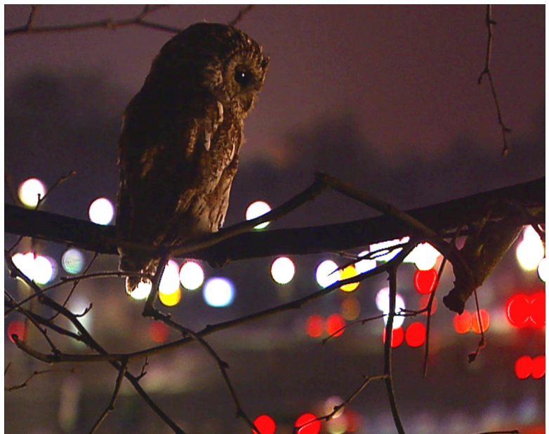
Ariane Michel, capture d'écran de Les Yeux ronds , 2005